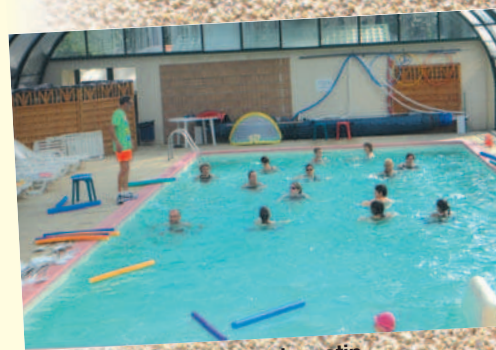
Aquagym du matin