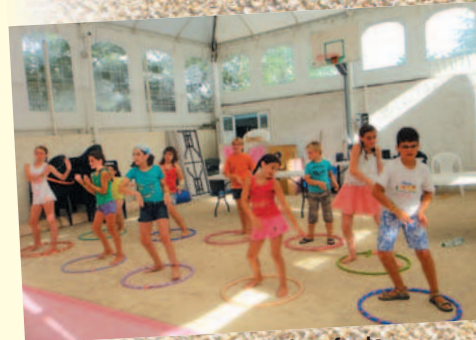
Ça bouge au club enfants