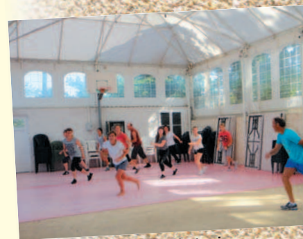
Réveil matin tonic

Pour tous renseignements 05 46 36 07 75 ou www.activ-loisirs.com Pour tous suppléments voir tarifs page 7