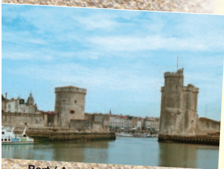
Port / Aquarium de La Rochelle