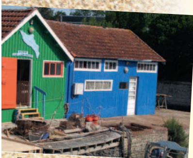
Bassin de Marennes-Oléron