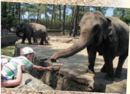
Zoo de La Palmyre