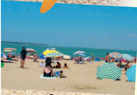
Ronce les bains