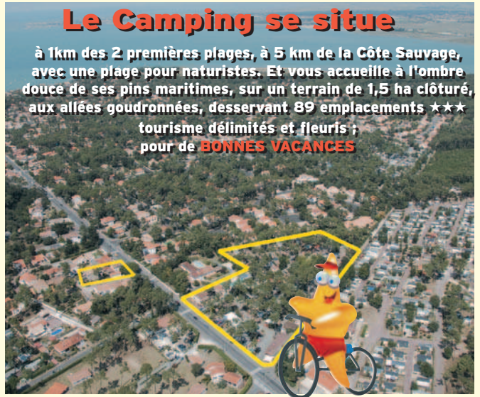
89 emplacements ★★★ Tourisme - arrêté N°2012-0010-DDPP/SPC du 20 janvier 2012 à la date de parution de la brochure

à 1km des 2 premières plages, à 5 km de la Côte Sauvage, avec une plage pour naturistes. Et vous accueille à l'ombre douce de ses pins maritimes, sur un terrain de 1,5 ha clôturé, aux allées goudronnées, desservant 89 emplacements ★★★ tourisme délimités et fleuris ; pour de BONNES VACANCES